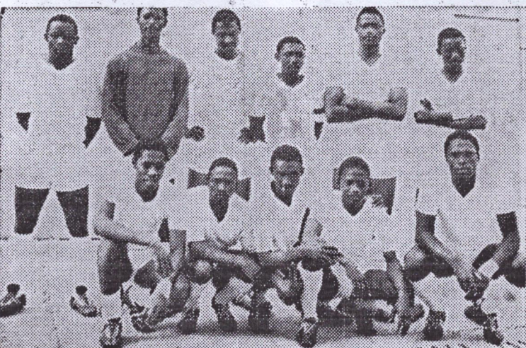
La formation de Conakry-II photographiée lors d'un précédent match.

Aujourd'hui, au Stade du 28 Septembre, en 1/4 de finale de la Coupe P.D.G. de football, se rencontreront les équipes de Conakry-I et Conakry-II.