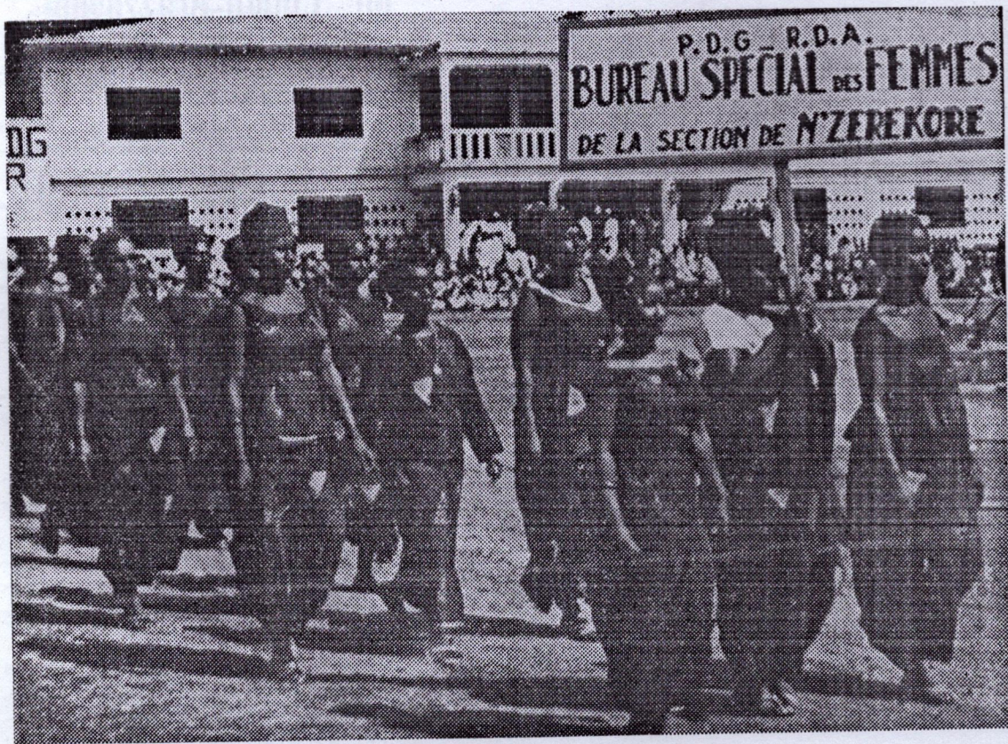
La marche des femmes de N'Zérékoré.

MILITANTS DU P.D.G. CONSIDEREZ-VOUS COMME SOLDATS ! ORGANISEZ-VOUS ! PRENEZ TOUTES LES INITIATIVES CREATRICES POUR CONSOLIDER LES BASES DE LA REVOLUTION !