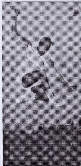
Sa concurrente Glioland (S.L.) à son dernier essai (4,42 m)