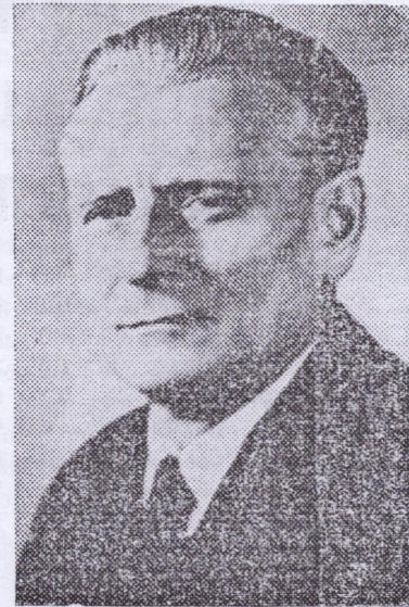
M. Antonin Novotny, premier secrétaire du C.C. du Parti communiste de Tchécoslovaquie, président de la République.

toujours des voies pour renforcer la paix et la sécurité dans le monde entier.