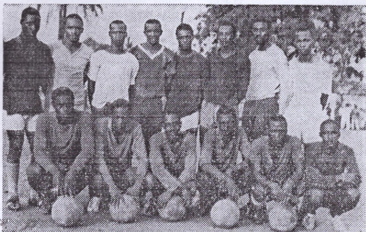
Conakry-I, tel qu'il se présente